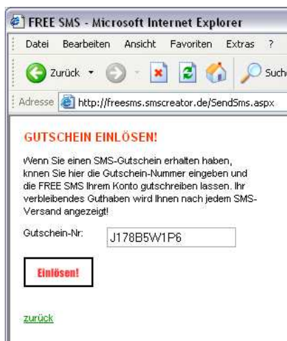
Abbildung 2.1 Gutscheine einlösen

Der User kann in dieser Seite seine Gutscheinnummer, welche Sie ihm z.B. auf einem Flyer ausgehändigt haben, eintragen und nach Klicken auf „Einlösen!“ freischalten.