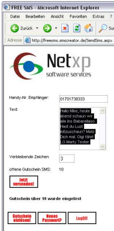
Abbildung 2.0 SMS-Versand

Im Versendebereich kann der User die Empfangsnummer eingeben. Bei deutschen Netzen ist eine Landesvorwahl nicht notwendig. Bei sonstigen Netzanbietern ist die Angabe einer Landesvorwahl anzugeben (+43667... oder 0043667, etc.).